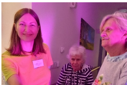
Pracovnice tančí s klienty