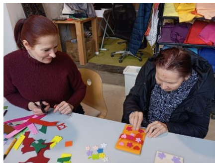
Fajna dílna 4