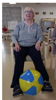
Cvičení s Luckou 4