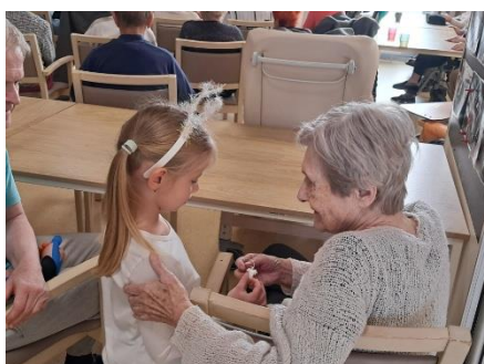
Vystoupení dětí z MŠ 3