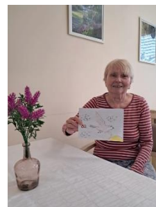
Oslava narozenin 3