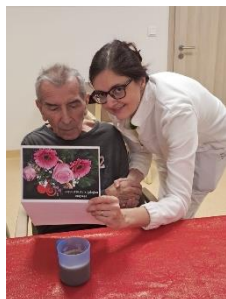
Oslava narozenin 5