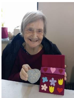
Fajna dílna 5