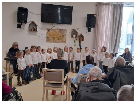
Vystoupení dětí z MŠ 1

Byla to moc milá návštěva, kterou jsme si všichni užili. Děkujeme za přízeň a těšíme se na jaro na další vystoupení.