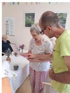
Oslava narozenin 2