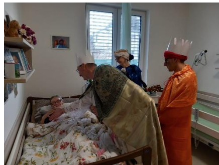
Tři králové 2