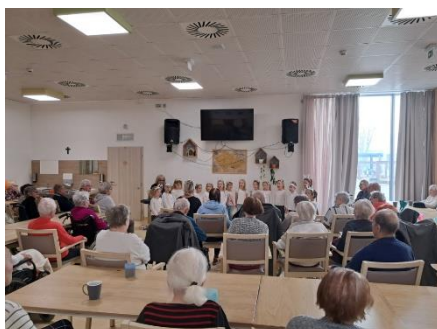
Vystoupení dětí z MŠ 5