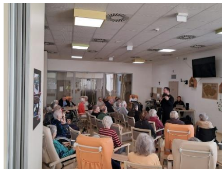
Vystoupení na Panovu flétnu 2