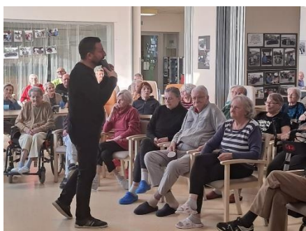
Vystoupení na Panovu flétnu 3