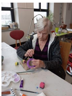
Fajna dílna 1

S klienty Senevida Ostrava - Vítkovice jsme opět navštívili FAJNOU DÍLNU ve Vítkovicích, se kterou dlouhodobě spolupracujeme při aktivizacích. Tentokrát jsme vybrali rukodělné vyrábění pro ženy a pro ilustraci přikládáme i několik fotografií z tohoto workshopu.