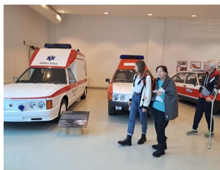
Výlet do muzea Tatra v Kopřivnici 6