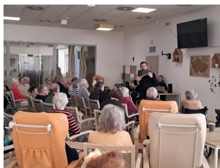
Vystoupení na Panovu flétnu 4