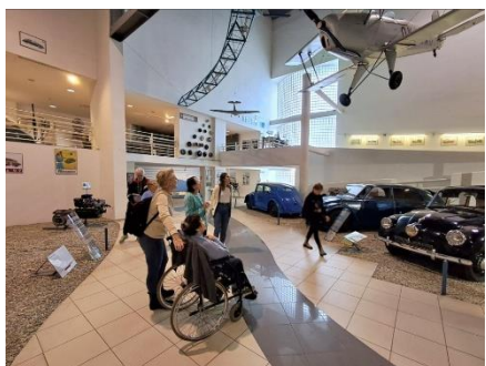
Výlet do muzea Tatra v Kopřivnici 3