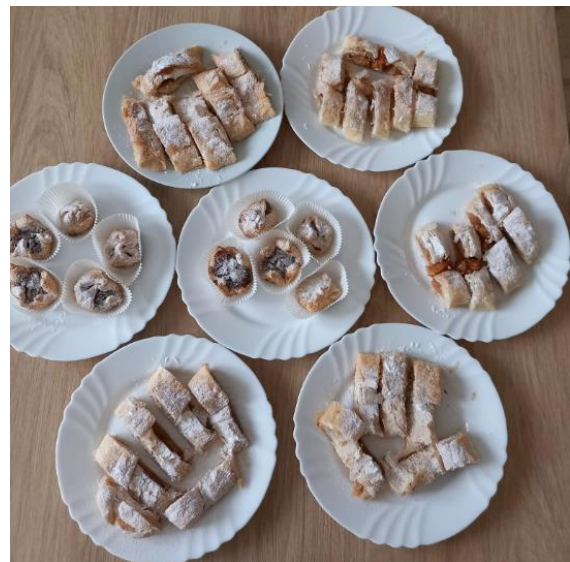
Pečení z listového těsta a jablek

Nastal čas sběru některých odrůd jablek, a tak jedna z našich aktivizačních pracovníků pár kousků doma ze zahrady zachránila před cestou do pálenice a donesla je k nám do Senevida Ostrava - Vítkovice, kde společnými silami s klienty upekli záviny a další dobroty. A pozor, tentokrát se činili hlavně pánové! Kalvádos je sice fajn, ale u nás frčí sladkosti a vždycky se po nich jen zapráší. 😊