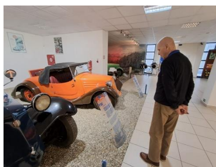
Výlet do muzea Tatra v Kopřivnici 2