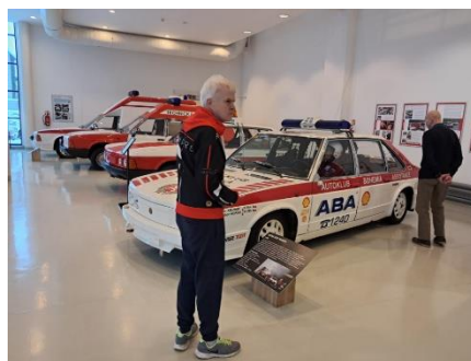
Výlet do muzea Tatra v Kopřivnici 4