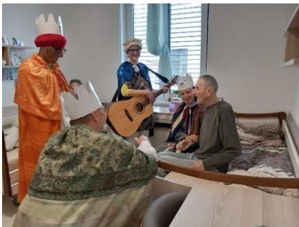
Tři králové 1