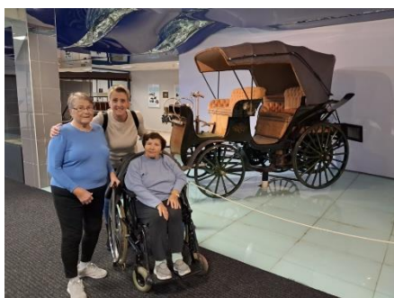
Výlet do muzea Tatra v Kopřivnici 5