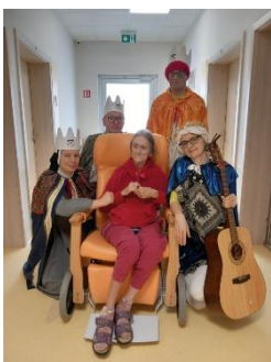
Tři králové 5