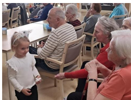
Vystoupení dětí z MŠ 4