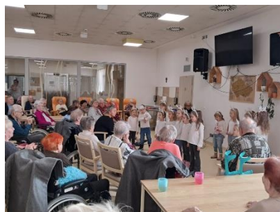
Vystoupení dětí z MŠ 2