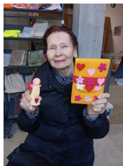
Fajna dílna 6