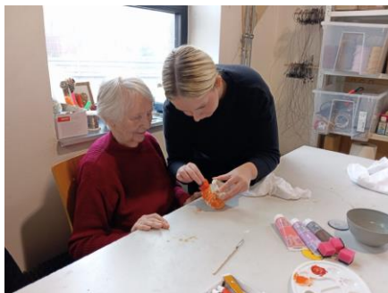
Fajna dílna 3