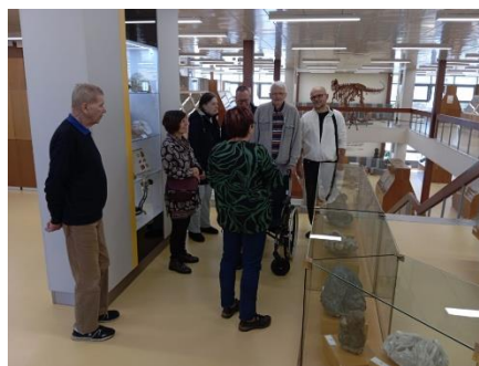
Návštěva Geoparku 2