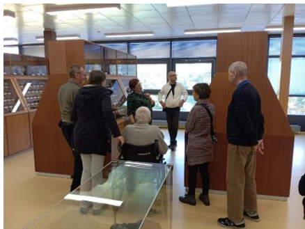
Návštěva Geoparku 5