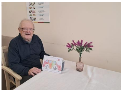
Oslava narozenin 1