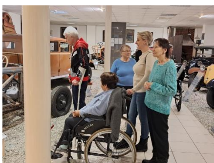
Výlet do muzea Tatra v Kopřivnici 1

Koncem listopadu jsme s našimi klienty Senevida Ostrava - Vítkovice podnikli výlet do muzea Tatrovky v Kopřivnici. Zdejší expozice se všem zúčastněným moc líbila a my máme v plánu další návštěvu, aby se nám klienti prostřídali, protože je tady opravdu kus automobilové historie a stále je zde co obdivovat.