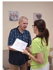
Oslava narozenin 6