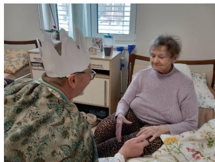
Tři králové 4