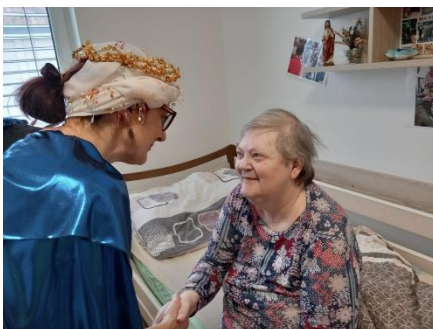
Tři králové 3