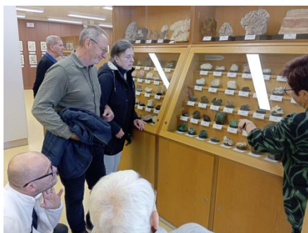
Návštěva Geoparku 1

Tento týden v pondělí jsme pro velký zájem opět navštívili s dalšími klienty geologický pavilon na Vysoké škole báňské – Technická univerzita Ostrava. Děkujeme paní Novákové za zprostředkování, děkujeme i skvělé paní průvodkyni a vlastně všem, kteří se nějakým způsobem podíleli na uskutečnění výletu. Bylo to moc fajn. V Senevida Ostrava - Vítkovice plánujeme stále další aktivity pro naše klienty. 😊