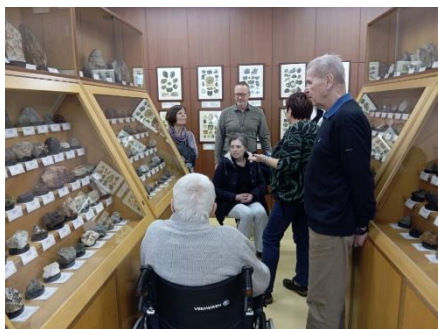
Návštěva Geoparku 3