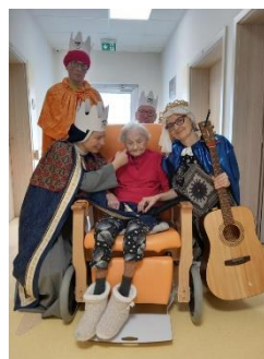
Tři králové 6