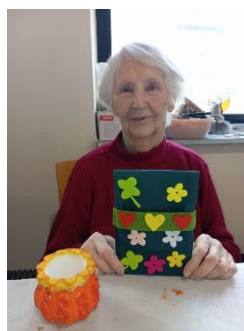
Fajna dílna 2