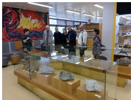
Návštěva Geoparku 4