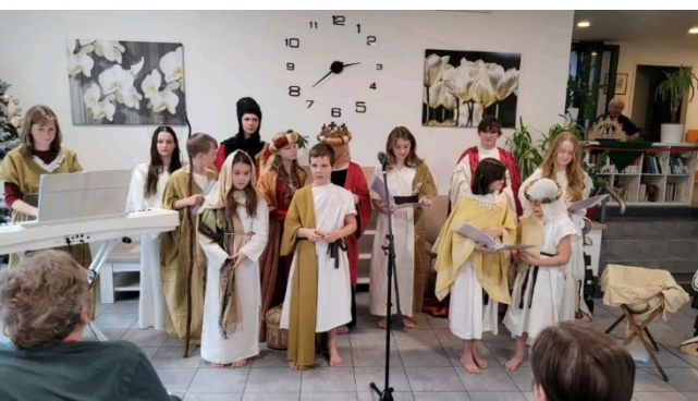
Divadelní uskupení ÚDIV