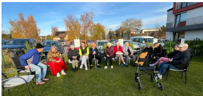
Společný čas na zahradě