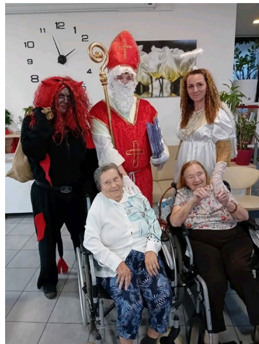
Mikuláš a jeho družina

Návštěva svatého Mikuláše s jeho družinou přináší vždy hřejivou atmosféru a úsměvy. Setkání s Mikulášem není jen o nadílce, je to chvíle, kdy se probouzejí milé vzpomínky a klienti s námi sdílí svoje životní příběhy. Hříšníků v domově mnoho nemáme, a tak se každý klient mohl těšit ze sladké nadílky.