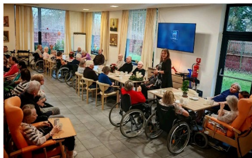
Vzpomínání na Vánoce v dětství