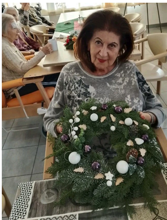
Zdobení vánočních věnců